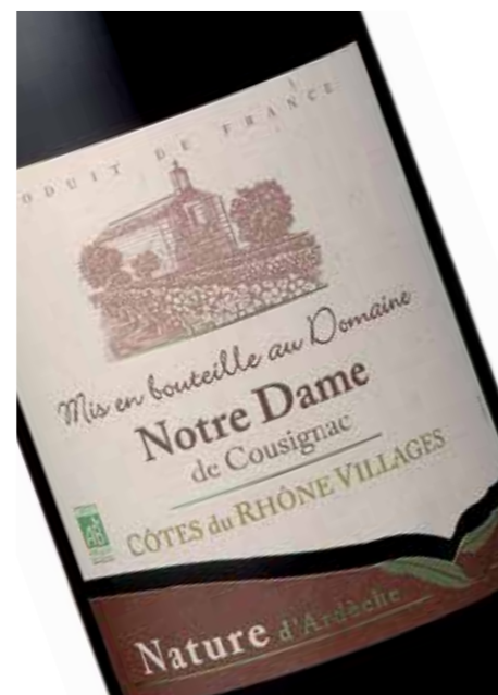
Notre Dame de Cousignac Rouge AC Côtes du Rhône Villages

Krachtige wijn met expressieve tonen van zwarte bessen en kersen. Fruitige smaken die ook terugkomen in de lange finale.