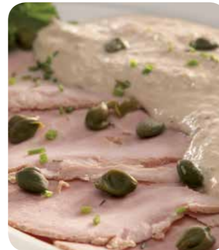
Vitello Tonato (voorgerecht) Benodigdheden voor 4 personen