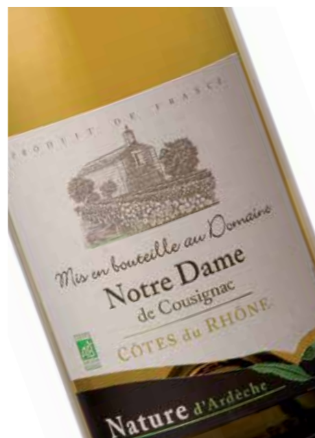
Notre Dame de Cousignac Blanc AC Côtes du Rhône

De wijngaarden van Notre Dame zijn de meest zuidelijke van de Rhône en liggen aan de andere kant van de rivier, recht tegenover Chateauneuf-du-Pape. Meer dan 60 hectare wordt al 25 jaar bewerkt zonder gebruik van insecticide of kunstmest. De wijnen profiteren van het natuurlijke ecosysteem en worden gemaakt door wijnboeren die milieuvriendelijkheid hoog in het vaandel hebben staan. Uit respect voor de wijngaard wordt veel van het werk handmatig gedaan. Elk stukje land wordt apart bewerkt, wat resulteert in een lage sap opbrengst en wijnen van hoge kwaliteit.