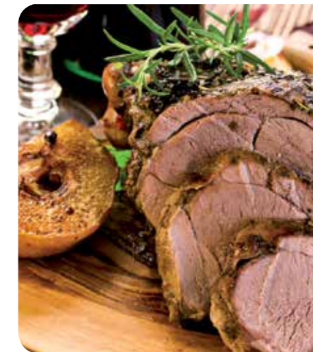
Gegrilde Lamsbout Benodigdheden voor 6 personen

Kook ondertussen de rijst volgens de aanwijzing op de verpakking. Verwarm wat olijfolie in de wokpan en bak de paprika en de boontjes 3 minuten lang op hoog vuur. Haal de groenten daarna uit de pan. Verwarm vervolgens de currypasta, zo komen de smaken vrij. Daarna voeg je de kokosmelk toe. Breng het geheel al roerend aan de kook. Vervolgens het vuur wat lager zetten en de vis toevoegen. Na 3 minuten koken de gebakken groenten en de bosuitjes toevoegen. Het geheel nogmaals 3 minuten laten koken. Daarna de vissaus, limoensap, basilicum en de koriander toevoegen en het geheel doorroeren. Serveer de curry en de rijst apart.