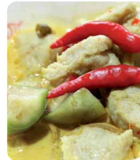
Thaise groene curry met witvis Benodigdheden voor 4 personen

Pureer de tonijn, de ansjovis, de mayonaise en olijfolie tot een gladde saus. Gebruik hiervoor eventueel een staafmixer. Halveer de citroen en breng de saus op smaak met het citroensap, peper en zout. Leg een laagje rucola sla op een bord en verdeel hierover de fricandeau. Verdeel vervolgens de saus over de fricandeau en verdeel de kappertjes over het gerecht. Besprenkel eventueel nog met wat citroensap.